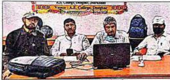
वेबिनार के आयोजन के दौरान उपस्थित कॉलेज के पदाधिकारी.

एस कॉलेज में कोविड-19 और पर्यावरणीय मुद्दे पर आयोजित अंतरराष्ट्रीय वेबिनार के दूसरे दिन मुख्य वक्ता डॉ एडीएम वाजपेयी ने केंद्र सरकार की नयी शिक्षा नीति की सराहना की और कहा जिस तरह राम जन्म भूमि पूजन एक ऐतिहासिक घटना थी वैसे ही यह शिक्षा नीति भी एक ऐतिहासिक कदम है. उन्होंने कोरोना के दौरान प्रदूषण के क्षेत्र में परिवर्तन अवश्य हुए लेकिन इसे अवसर नहीं कहा जा सकता है. मानवीय हस्तक्षेप को कम करके पर्यावरण को सुधारा जाना चाहिए, क्योंकि प्रकृति को जब हमने आय का साधन बनाया तभी समस्या बढ़ी. अफ्रीका के वेनिन कैपस से डॉ मनोज कुमार मिश्रा ने कहा कि अंतरराष्ट्रीय स्तर पर कोरोना एक महामारी के रूप में अवश्य आया लेकिन वातावरण में परिवर्तन जो दिख रहा है,