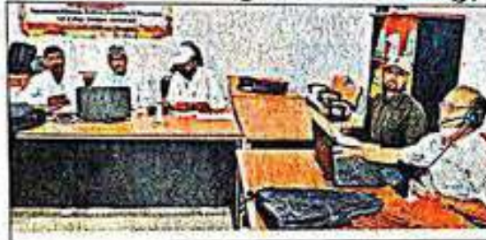
एस कॉलेज में वेबिनार में जुड़े शिक्षाविद.